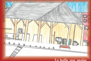
La halle aux grains

histoire de cette petite cité est étroitement liée à celle de la famille de Rohan, dès 1120. Roc'han signifie en breton « petit rocher », il s'agit du promontoire rocheux au bord de l'Oust où fut construite leur forteresse. Rohan devint le chef lieu de la Vicomté dès le XII e siècle, jusqu'en 1396. Bien plus tard, la construction du canal de Nantes à Brest fit de Rohan un haut lieu commercial et d'échanges. Découvrez l'histoire de Rohan et son riche patrimoine, à travers 10 étapes équipées d'un panneau vous expliquant ses origines et ses trésors.